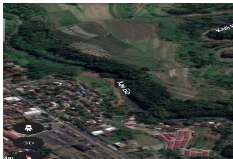
Gambar 1. Lokasi Pengambilan Sampel