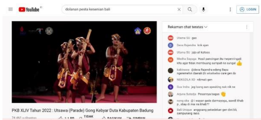
Gambar 4. Jejak digital live streaming Youtube Parade Gong Kebyar PKB 2022 (sumber: https://www.youtube.com/watch?v=_nFNuQGfeQE )

Dinas Kebudayaan Bali melalui akun resmi youtubanya baru mulai meresponse peluang digitalisasi ini sejak tahun 2021, sedikit lebih lambat jika dibandingkan dengan channel yang lainnya, namun upaya ini harus tetap diberikan apresiasi dengan demikian data dokumentasi terkait dengan permainan tradisional yang digarap ulang melalui pertunjukan dolanan anak masih dapat dinikmati dan ditonton oleh masyarakat yang ada diluar Bali, tidak hanya berupa rekaman yang diupload saja, bahkan masyarakat dapat merasakan euphoria pementasan tersebut secara realtime melalui siaran langsung yang disiarkan di Youtube.