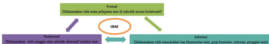
Gambar 1. Lingkup formal, informal, dan nonformal dalam pendidikan seni berbasis masyarakat

pemerintah dan masyarakat. Program pendidikan seni berbasis masyarakat dapat menjawab kebutuhan-kebutuhan kreatif imajinatif dan inovatif serta minat seorang melalui orang dewasa atau partisipasi masyarakat. Ini memberikan ruang terbuka bagi kapasitas diri menjadikan pendidikan seni menjadi lebih bermakna sebagaimana yang diamanatkan oleh UNESCO 2006 dalam road map for art education bahwa pendidikan seni memiliki dua fungsi utama yaitu mengakomodasi kapasitas kreatif dan kesadaran budaya (Rohidi, 2021). Pendidikan seni melalui sebuah Pewarisan, Apresiasi, arena ekspresi kreatif diharapkan mampu mengakomodasi kapasitas kreatif dan kesadaran budaya pada persoalan merdeka belajar: inovasi pembelajaran seni tari dalam membangun karakter kreatif.