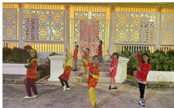
Gambar 3. Inovasi pembelajaran tari melalui kegiatan mengekspresikan diri di arena Museum SMB II berdasarkan musik ta yang mampu menjadikan peserta didik lebih percaya diri dan bebas mengolah tubuh ke dalam ruang tari di era merdeka belajar.

tersebut, digunakan dalam proses pelaksanaan kreativitas dalam bentuk penilaian kinerja peserta didik. Guru menilai hasil kreativitas peserta didik dalam bentuk deskripsi untuk dicantumkan pada raport peserta didik yang menggunakan kurikulum 2013. Kreativitas yang dilakukan oleh pihak sekolah dimaksudkan untuk mengetahui bagaimana hasil pembelajaran tari yang telah peserta didik pelajari selama kegiatan belajar mengajar berlangsung, serta untuk melatih rasa percaya diri peserta didik dalam menampilkan bakatnya di depan umum. Hasil yang dicapai oleh para peserta didik dalam meningkatkan kreativitas menjadikan peserta didik lebih percaya diri terlihat pada penampilan peserta didik yang lebih membaik dari sebelumnya. Saat diadakannya beberapa acara sekolah mereka menampilkan tarian-tarian yang sudah dipelajari salah satunya tari Rindu Palembang.