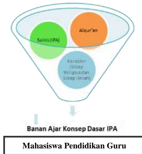
Gambar 2. Model Bahan Ajar Konsep Dasar IPA Pendekatan ALSAK