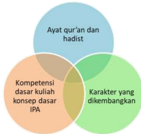
Gambar 3. Deskripsi Langkah 1 Pengemasan Bahan Ajar Konsep Dasar IPA Pendekatan ALSAK