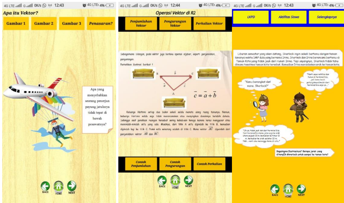
(tampilan screen pembelajaran dengan pendekatan problem based learning )